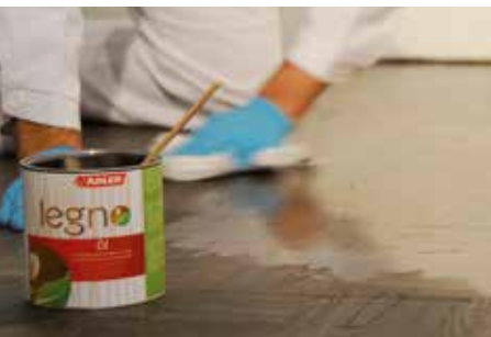
VORGANG MIT LEGNO-ÖL ODER -HARTWACHSÖL WIEDERHOLEN