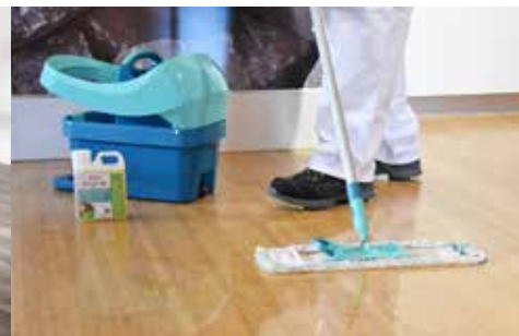
BODEN MIT DEM SEIFENWASSER WISCHEN – KEINE PFÜTZEN STEHEN LASSEN!