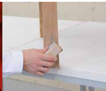
VERKRATZTE FLÄCHE ANSCHLEIFEN