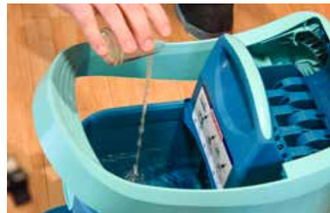
MISCHVERHÄLTNIS SEIFE UND WASSER BEACHTEN.