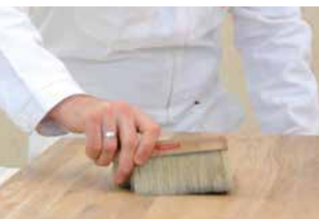
STAUB UND SCHMUTZ ENTFERNEN